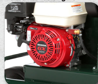
Cárter del cigüeñal de 1 L (34 onzas)