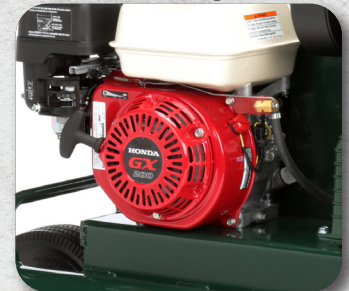
34 oz. Crankcase Prefilled with Oil